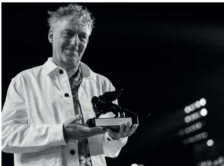
Jacopo Salvi. Courtesy La Biennale di Venezia